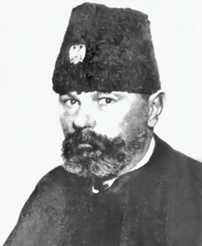
Војвода Кости Миловановић Пећанца, вођа устанка и командант Централној четничкој одреди

У јесен 1916. године Ибарско-копаоничка чета прераста у Ибарско-копаонички четнички одред. Његова устаничка активност шири се на Прокупље, Нови Пазар, Брус, Куршумлију, Лебане, Медвеђу, Гњилане, Приштину и Косовску Митровицу. У поткопаоничким селима која припадају Брусу – Ливадју, Радманову, Блажеву, Белом Пољу, Влајковцима и Дупцима радила је тајна четничка организација. Она је, нажалост, откривена и осам њених организатора су 14. јула 1916. јавно обешени у Крушевцу.