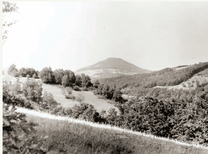
Бабин зуб и Туралски вис: устаничко подручје