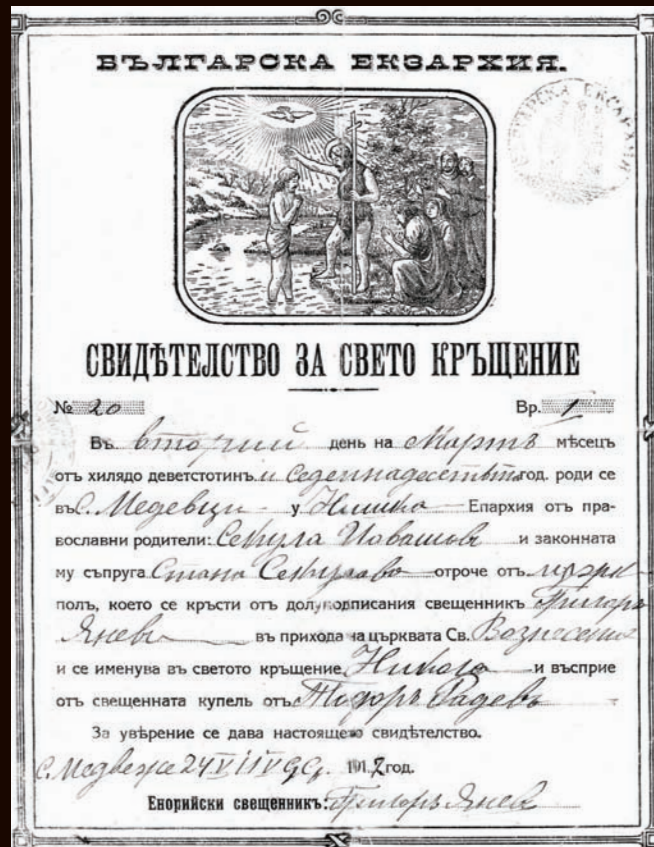
Бугарска кршћеница за српско новорођенче

За све време окупације Србије бугарски и аустроугарски војници и официри фотографисали су се поред обешених или стрељаних Срба. И на дописним картама била су представљана варварства, а у књижевним радовима Вазова и Христова отворено је позивано на тотално истребљење Срба: „...да не остане камен на камен, да се ни једно