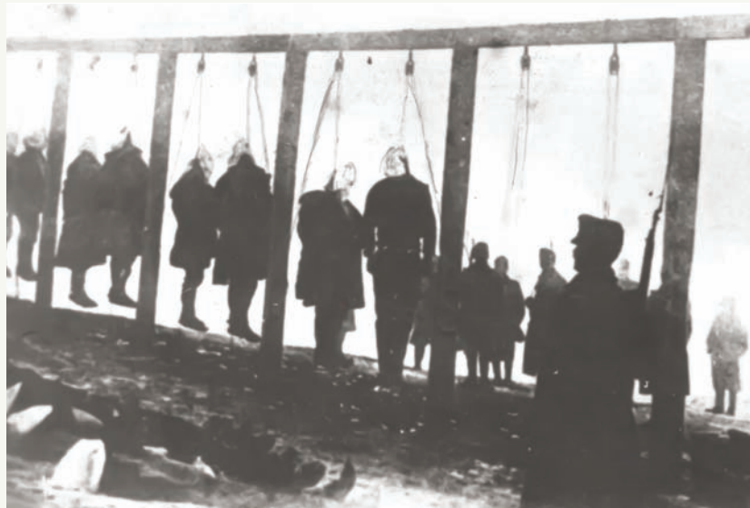
Аустријарска вешала у Крушевцу

Пуковник Александар Протогеров, командант Моравске области, за успех у гушењу устанка у Топлици награђен је генералским чином, иако је његова армада у обрачуна са устаницима и цивилима драстично прекршила