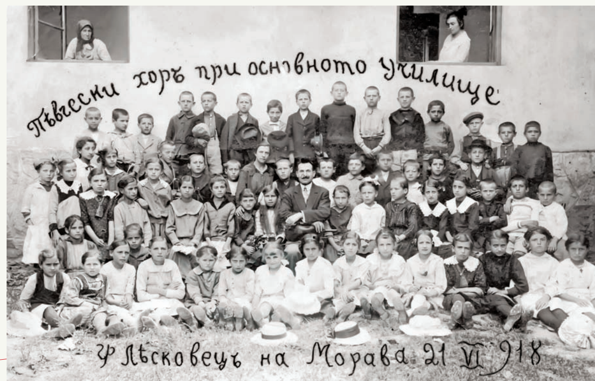
Деци за усйомену, на крају школске године

окупациона зона имала је шест војних округа: Београд, Шабац, Ваљево, Горњи Милановац, Крагујевац и Туприја.