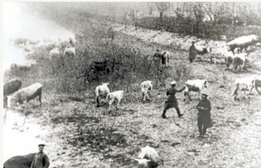
Зайлена стоке од бугарских окуписајора

Злочини бугарског окупатора су, у ствари, материјализација одавно смишљене стратегије уништавања једног