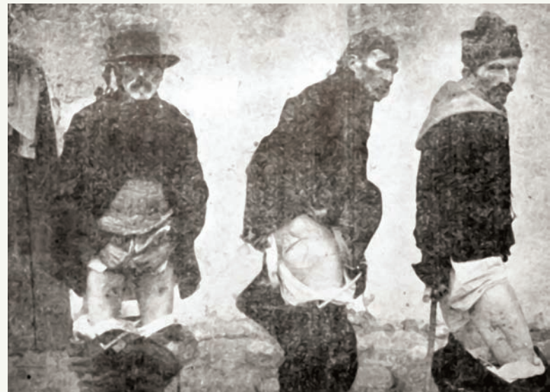
Сељаци из Тојлице са браздама од бујарских удараца и кама