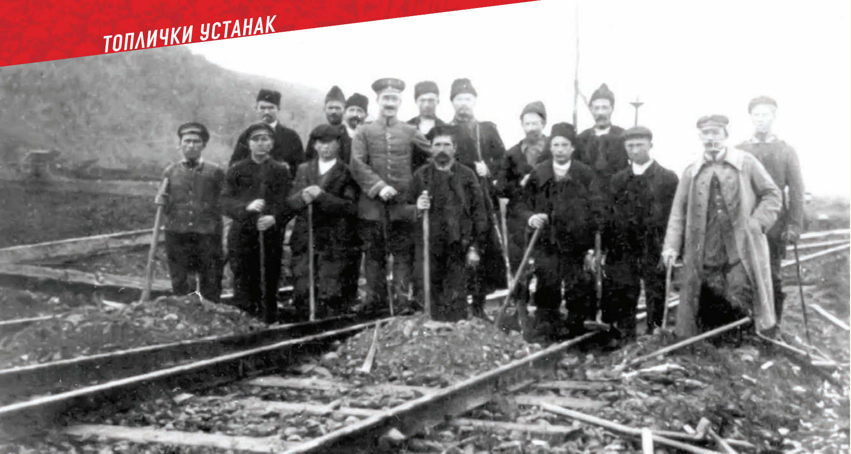
Принудан кулук за окупиране Србе, на њрузи Ниш–Лесковац

ни власти и школство. У „Морави” и на Косову Бугарска је организовала 14 команди и надлештава, неку врсту комбиноване војне и цивилне управе.