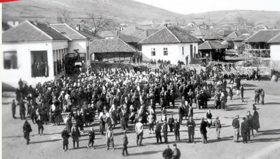
Лебане: народ кличе слободи

Устанак је био део ослободилачке борбе Србије и савезника у Првом светском рату. Створена је велика слободна територија за центром у Прокупљу.