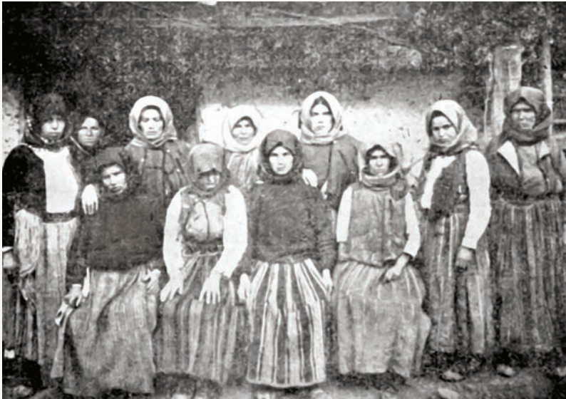
Сељанке из Горње Маџејевца код Ниша силоване од Бугара

О бугарским злочинима у том крају у Извештају међународне комисије за испитивање злочина стоји: „Овде нису само убијани људи и жене, већ су вршени сви видови мучења и спроведени облици садизма, као што су: набијање на колац, што су измислили Турци, убијање на тенане спаљивањем на људождерски начин, силовање мајки у присуству кћери или кћери у присуству мајке, предаја жена на блуд са псима, сакаћење полних органа итд.” Овај документ потписали су Француз А. Бонасје и енглески пуковник Х. Б. Мејн.