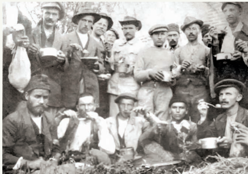
Топлички устаници-заробљеници у Бугарској на ручку (снимљено за бугарску јоштанску картицу)

Окупатор је са доста мука и уз жесток отпор српских бораца, после извесног времена, успео да освоји устаничка подручја. Аустроугарска војска је, заједно са Бугарима, 13. марта 1917, увече, ушла у Прокупље. Три дана касније, 16. марта, Аустријанци су заузела Куршумлију и Блаце. Такав след догађаја био је могућ и због несагласја међу устаничким командантима у погледу одбране слободне територије. Пећанац, вођа устанка, напустио је положај и борбу и са