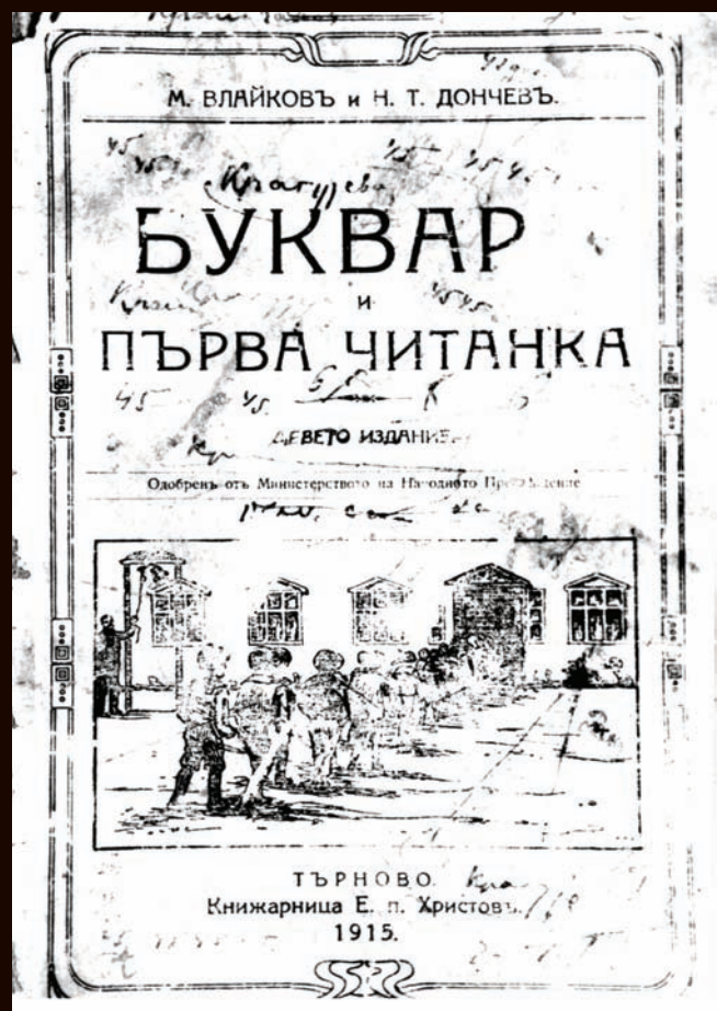
Уџбеници за српске ђаке сџишли су из Буџарске: Буквар и прва читанка