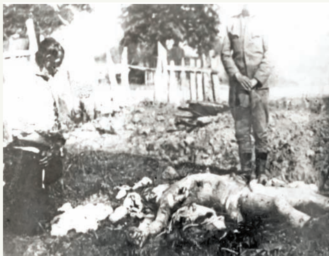
Бугарска зверства у Прокуљу